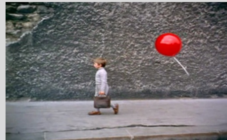
The red balloon, short film, 1956